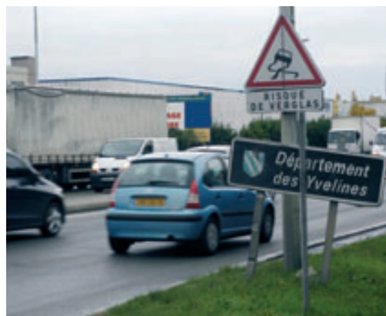
RN 184 : bienvenue dans les Yvelines !

Accessoirement à sa décision sur l'A 104, le Ministre a décidé de la requalification de la RN 184. Dans son discours, il assigne à ce projet de « permettre le développement des transports en commun, des cheminements cyclistes ». C'est une vision particulièrement idyllique mais parfaitement inaccessible pour les Conflanais puisque pour eux la 184 et la 104 ne feraient qu'un et que le trafic routier, avec gros porteurs internationaux s'il vous plaît, y passerait de 50 000 véhicules par jour actuellement, à 150 000.