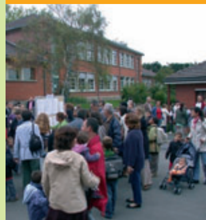
Le groupe scolaire Paul Bert-Gaston Rousset-Le Confluent et sur la droite, derrière la haie... l'autoroute.

Les Conflanais subissent déjà plusieurs pollutions auxquelles s'ajouteraient celles de l'autoroute si elle se réalisait : nuisances sonores, olfactives avec l'usine des eaux, nuisances de la RN 184. Sans compter la proximité de l'A15 ainsi que le trafic provenant des autres communes vers nos gares, source de difficultés de circulation et de stationnement.