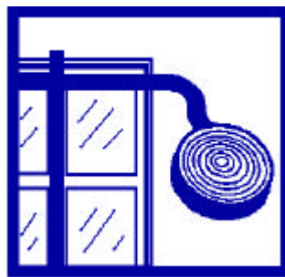
Bouchez toutes les arrivées d'air