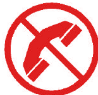
Ne téléphonez pas : Libérez les lignes pour les secours

Pour connaître ce risque et sa prévention, consultez dès maintenant le dossier complet en mairie