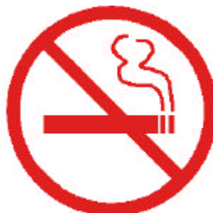
Ni flamme, ni cigarette