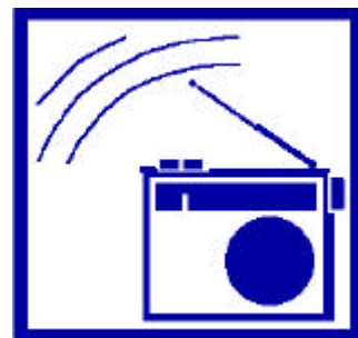
Ecoutez la radio : Pour connaître les consignes à suivre