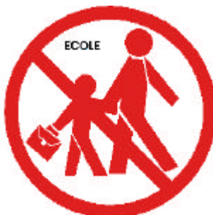
N'allez pas chercher vos enfants à l'école : l'école s'occupe d'eux