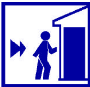
Enfermez-vous dans un bâtiment