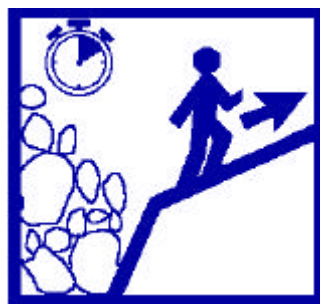
Gagnez un point en hauteur