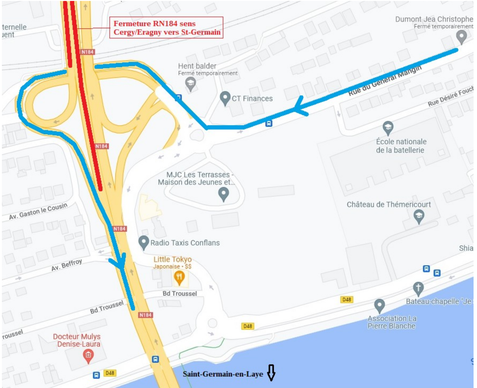
Zoom sur la fin de la déviation