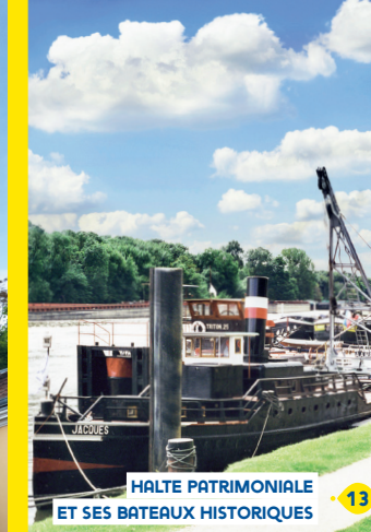
HALTE PATRIMONIALE ET SES BATEAUX HISTORIQUES 13