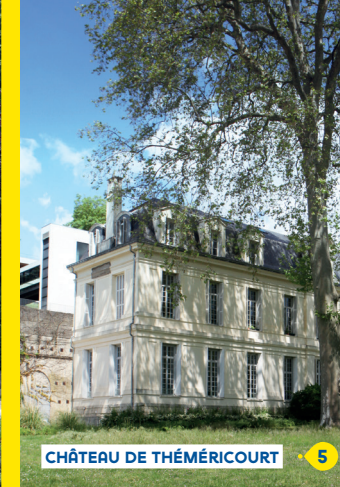
CHÂTEAU DE THÉMÉRICOURT 5