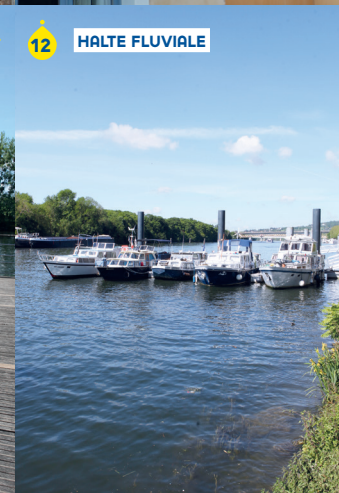
HALTE FLUVIALE 12