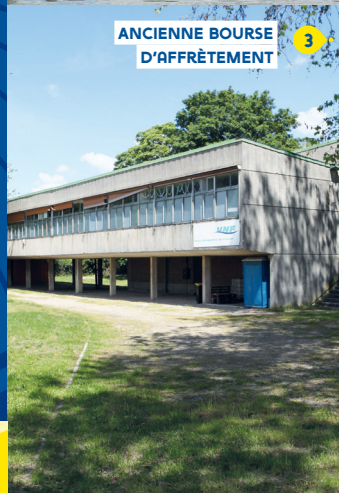
ANCIENNE BOURSE D'AFFRÈTEMENT 3