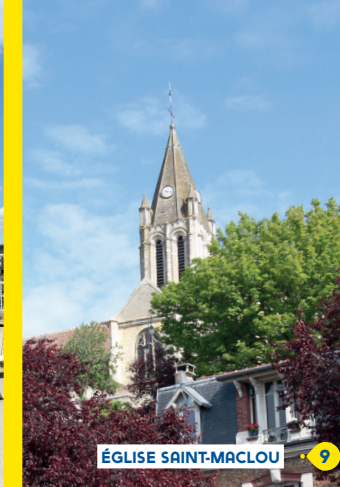
ÉGLISE SAINT-MACLOU 9