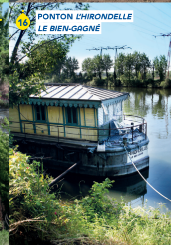
PONTON L'HIRONDELLE LE BIEN-GAGNÉ 16