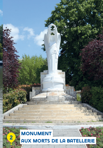
MONUMENT AUX MORTS DE LA BATELLERIE 2