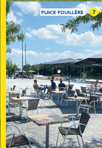
PLACE FOUILLÈRE 7