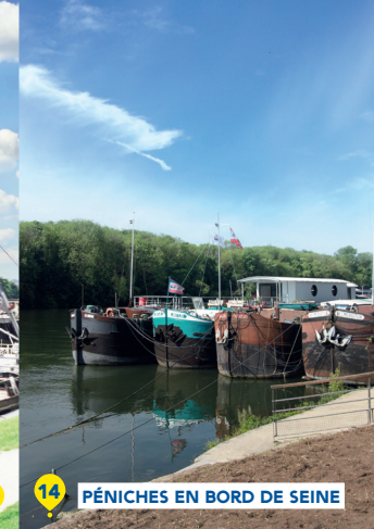
PÉNICHES EN BORD DE SEINE 14