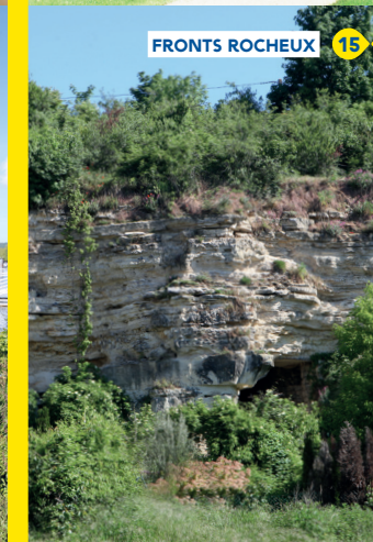
FRONTS ROCHEUX 15