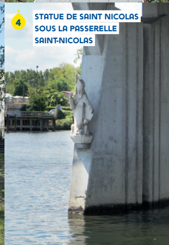
STATUE DE SAINT NICOLAS SOUS LA PASSERELLE SAINT-NICOLAS 4