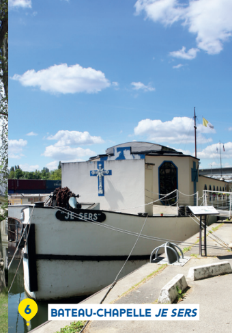
BATEAU-CHAPELLE JE SERS 6