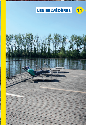
LES BELVÈDÈRES 11