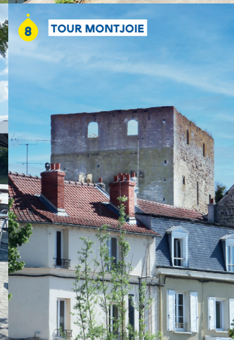
TOUR MONTJOIE 8