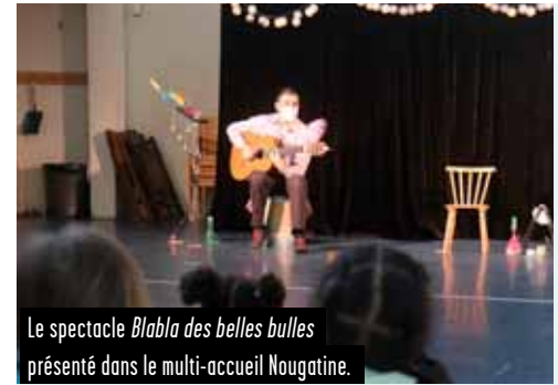
Le spectacle Blabla des belles bulles présenté dans le multi-accueil Nougatine.