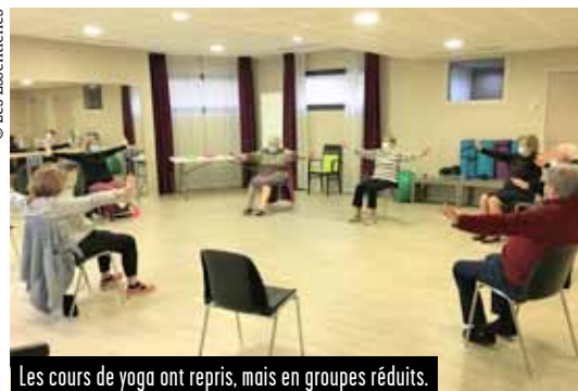
Les cours de yoga ont repris, mais en groupes réduits.