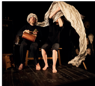
© Laura Nathan - Spectacle Nasreddine

01 39 19 42 97 cdeds78.secourisme@gmail.com