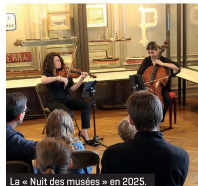
La « Nuit des musées » en 2025.

À l'occasion de la « Nuit européenne des musées », le Musée de la batellerie et des voies navigables organise le samedi 23 mai une soirée exceptionnelle pour plonger dans l'univers du transport fluvial. Cet événement permettra de (re)découvrir l'exposition organisée à l'Orangerie concernant le canoë canadien mais aussi d'admirer le grand cellier médiéval [collection de bateaux de plaisance], spécialement ouvert et mis en lumière.