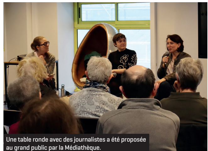
Une table ronde avec des journalistes a été proposée au grand public par la Médiathèque.

La Médiathèque a proposé, le 28 mars dernier, une table ronde « Désinformation et fact-checking », avec l'association La Chance.