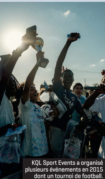
KQL Sport Events a organisé plusieurs événements en 2015 dont un tournoi de football.