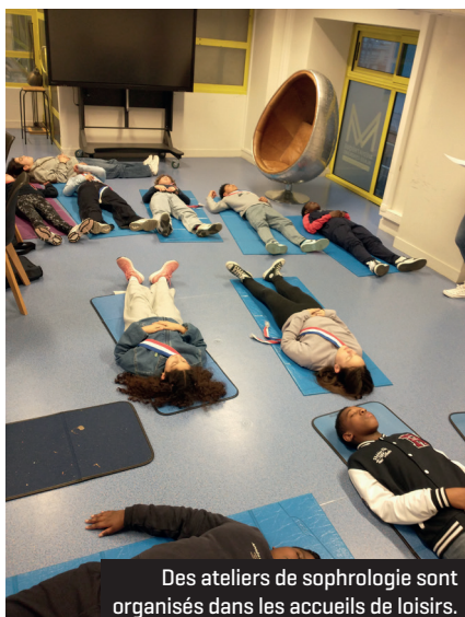
Des ateliers de sophrologie sont organisés dans les accueils de loisirs.

3018 – Élèves, parents, professionnels : un numéro Vert et une application mobile sont à votre disposition pour tout renseignement ou signalement