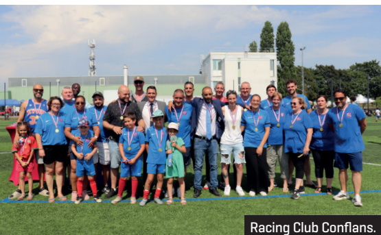
Racing Club Confians.

Conservatoire, écoles et associations ont concocté des rendez-vous festifs pour rassembler élèves et membres dans un esprit de partage et de détente.