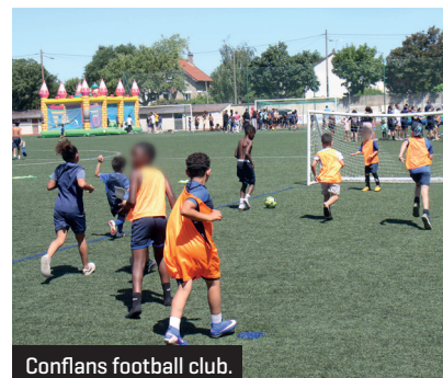
Confians football club.