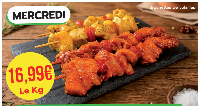
Brochettes de volailles

PROMOTIONS DE JUILLET & AOÛT AU RAYON BOUCHERIE