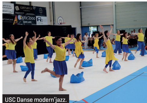
USC Danse modern'jazz.